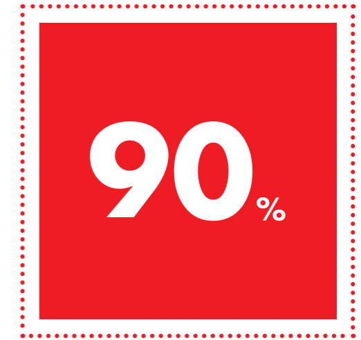
Duy trì lượng HIV dưới ngưỡng ức chế